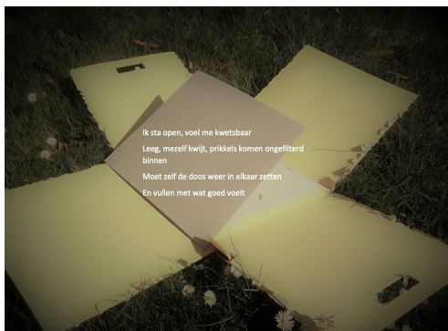
Foto 1 omvat haar gevoelens van het moment van de intake.