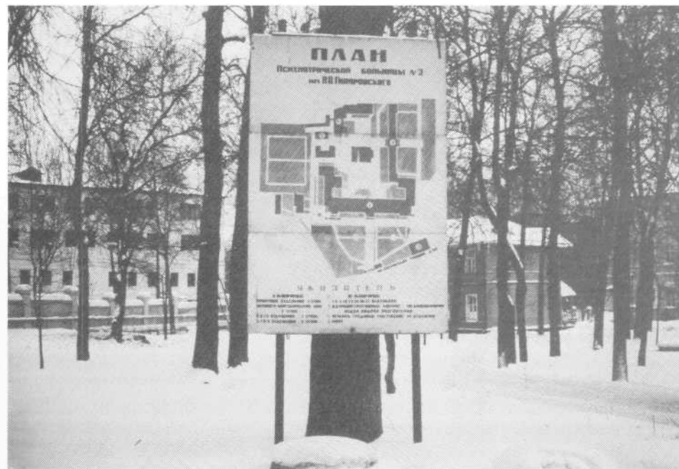
Plattegrond van de kliniek

Mevr. Larissa begon ons enige informatie te verschaffen over deze kliniek.