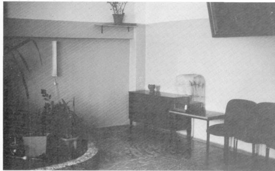
De dagzaal in de kliniek

Slechts een enkeling reageert verstoord. De afdeling ziet er sober uit. Het dagverblijf heeft een TV, een kooi met twee parkieten en een grote, door een laag muurtje omgeven plan-