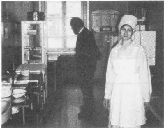
"De sanitair" (verpleeghulp)

Verder noemde ze dat de mensen mondiger worden. Patiëntenverenigingen kent men echter niet. Inzagerecht voor patiënten in het eigen dossier is nog niet geregeld.