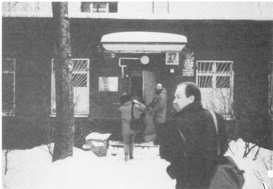
De ingang van de dispensaire...

Patiënten kunnen nu verzoeken om uit het register geschrapt te worden. Hiervan wordt nog maar weinig gebruik