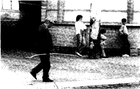
relatie aangaan met de cliënt