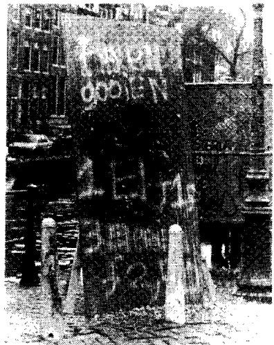
de ruime ervaring van de SPV