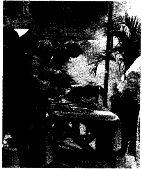
waar rook is, is vuur