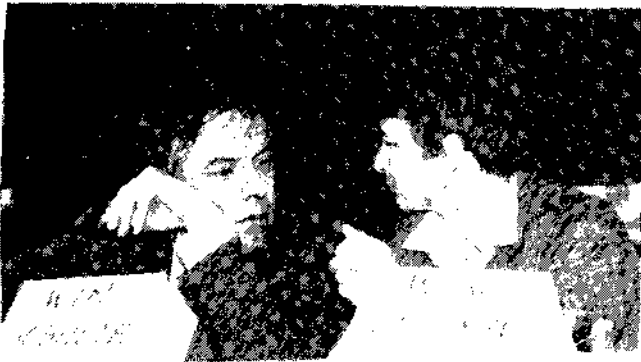
De leden van het forum

Mogelijk dat dit mensen warm kan maken voor activiteit binnen de vereniging.