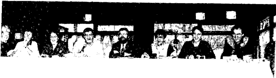
Gelukkig ook tijd voor lachen